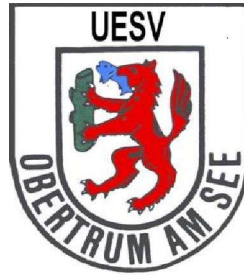
Vereinslogo von 1989 - 2013