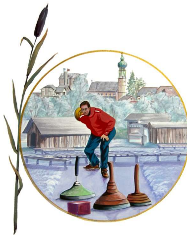
Gemälde von Sulpicius Bertsch Obertrum am See