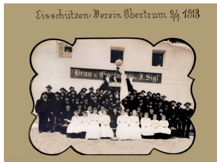
Gründungsfoto vom 9.Jänner. 1913