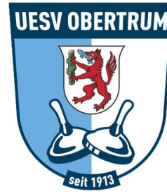
Vereinslogo ab 2013